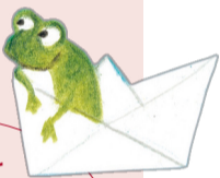
Illustration: Michael Röber, aus „Guten Morgen, schöner Tag!“ von Elisabeth Steinkeller

Download aller Bilderbuch-Kalender: www.tyroliaverlag.at/bilderbuchkalender